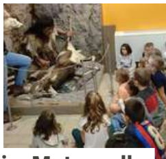
Accueil de loisirs Maternelle, Primaire et Passerelle